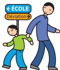
N'apprécie pas les changements