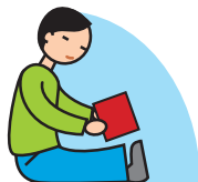
Manque de jeux imaginatifs