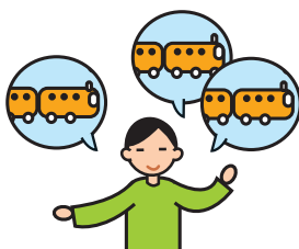
Parle de façon incessante sur un sujet particulier