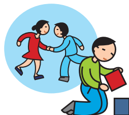
Ne joue pas avec les autres enfants