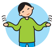
Présente des comportements bizarres