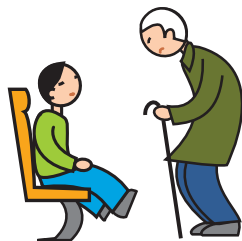
Comprend mal les conventions et les règles sociales