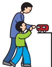
Indique ses besoins en utilisant la main d'un adulte