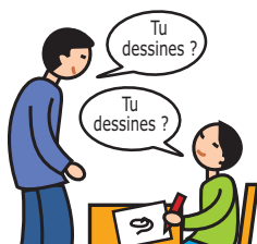
Utilise le langage de façon écholalique