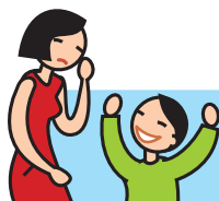
Rit de façon inappropriée