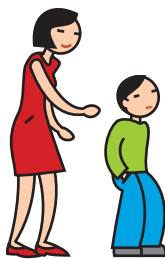
Manifeste de l'indifférence