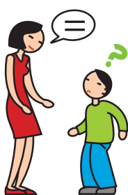
A du mal à comprendre et à se faire comprendre