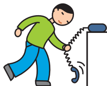
Utilise les objets de façon atypique